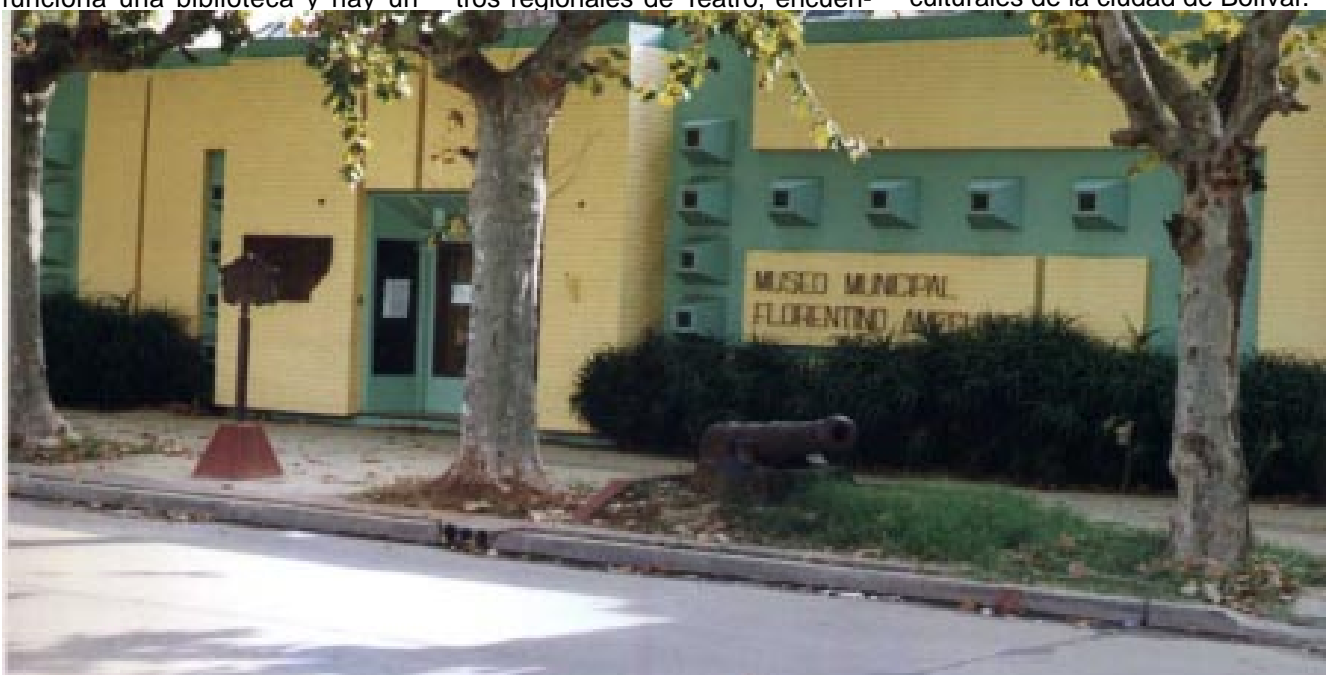
Museo Municipal Florentino Ameghino

Con prontitud el Café Literario se transformó en un lugar que renueva y acrecienta las posibilidades culturales de la ciudad de Bolívar.