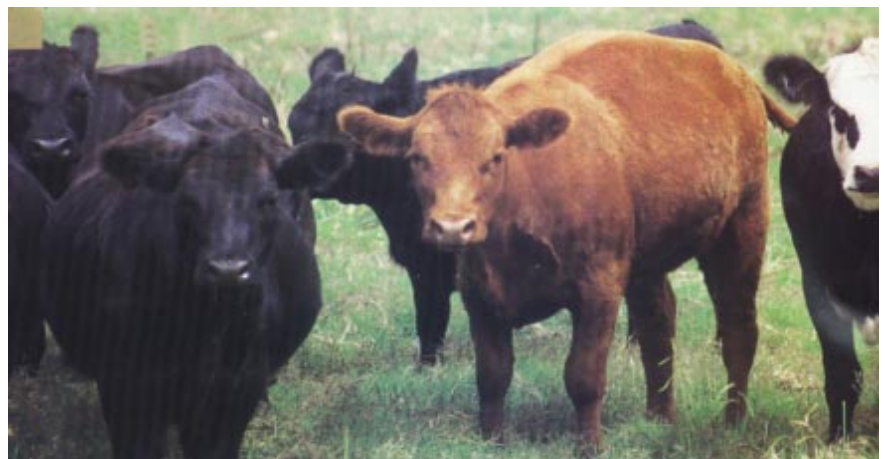
Bolívar es uno de los cinco partidos con mayor cantidad de ganado bovino en la provincia de Bs. As.

hielo, fabricación de artículos de cemento y fibrocemento, fabricación de mosaicos, fabricación de bloques y ladrillos, fabricación de muebles, actividades de aserraderos y preparación de maderas, confección de artículos de lona, trabajos de imprenta y encuadernación, fabricación de textiles varios, construcción de maquinarias y equipos para agricultura, reparación de maquinarias y equipos para agricultura, fabricación de acumuladores, fabricación de silos, fabricación y armado de letreros, entre otros.