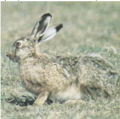
La liebre europea, de increíble adaptación a la región, ha sufrido una disminución considerable en su población, debido a la caza comercial de la que es objeto

El Partido de Bolívar forma parte de esa extensa llanura, de más de 400.000 kilómetros cuadrados, comunmente denominada llanura pampeana. Una de las características principales de esta enorme planicie de horizontes ilimitados es la ausencia de árboles, más allá de la solitaria presencia de escasos ejemplares de ombúes. Esos pocos ejemplares causaron la equívoca