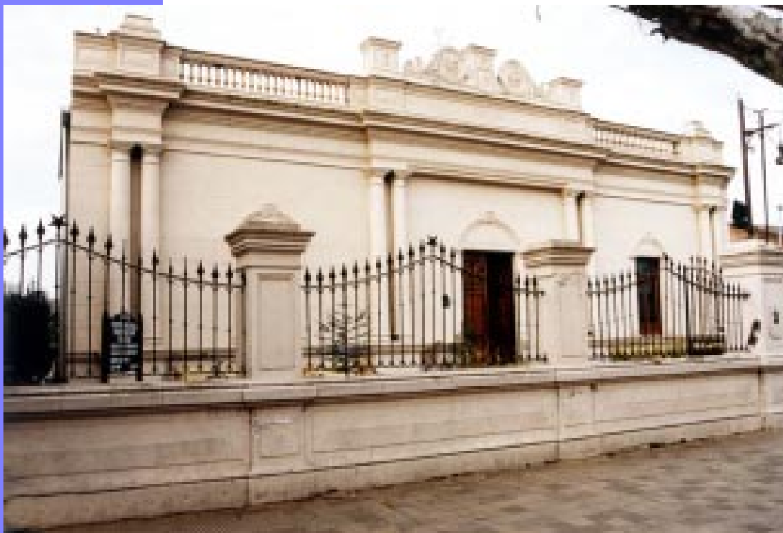
Centro Regional Universitario de Bolívar

“...Cuando gallardo y henchido de esperanzas traspases los umbrales del colegio con ansias de aprender un algo nuevo, acuerdate de aquellos... a quien con lástima llaman analfabetos...”