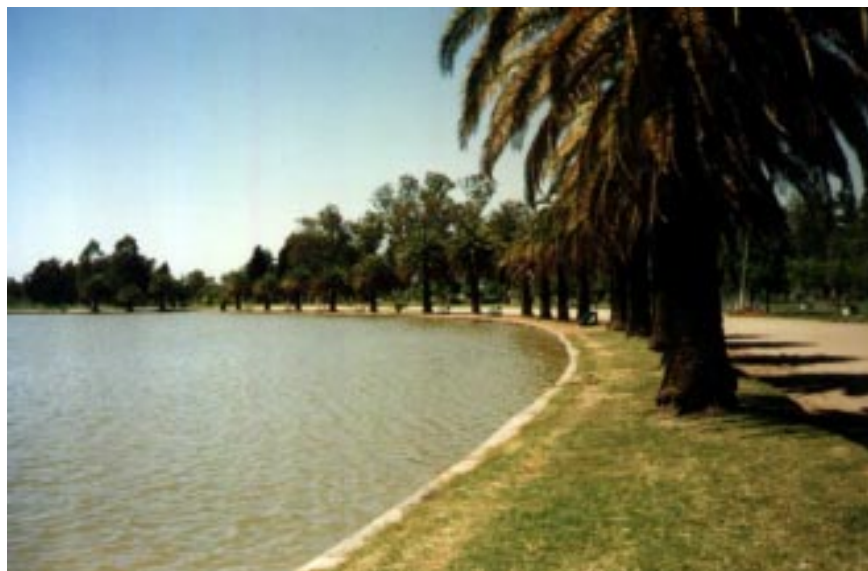
Parque Municipal "Las Acollaradas"

Dentro del Parque también se encuentran el Estadio Municipal, con