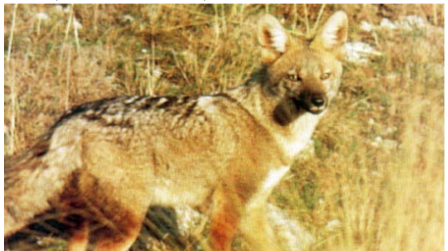
El zorro pampeano de hermoso manto con reflejos plateados, diezmado en una época por los cazadores, en la actualidad ha aumentado considerablemente su población en el Partido de Bolívar y la región.

Mamíferos: venado de la pampa, gato montés, gato de los pajonales, zorro pampeano, hurón mediano, zorrino, peludo, mulita, comadreja