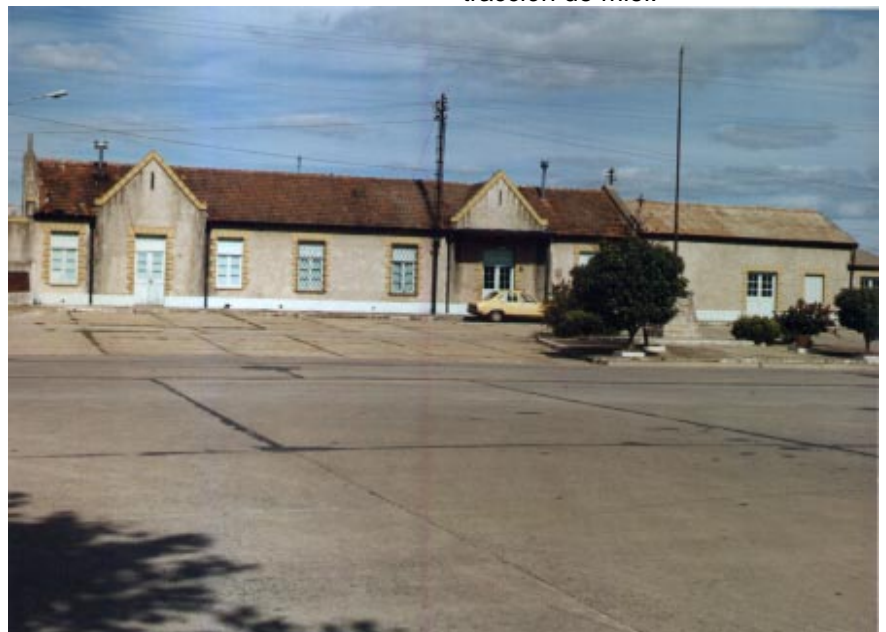
El 31 de julio de 1898 llegó el tren por primera vez a la estación de Bolívar.

Actualmente funcionan en el lugar un frigorífico, dos fábrica de lácteos, una fábrica de columnas de cemento, un aserradero y una sala de extracción de miel.