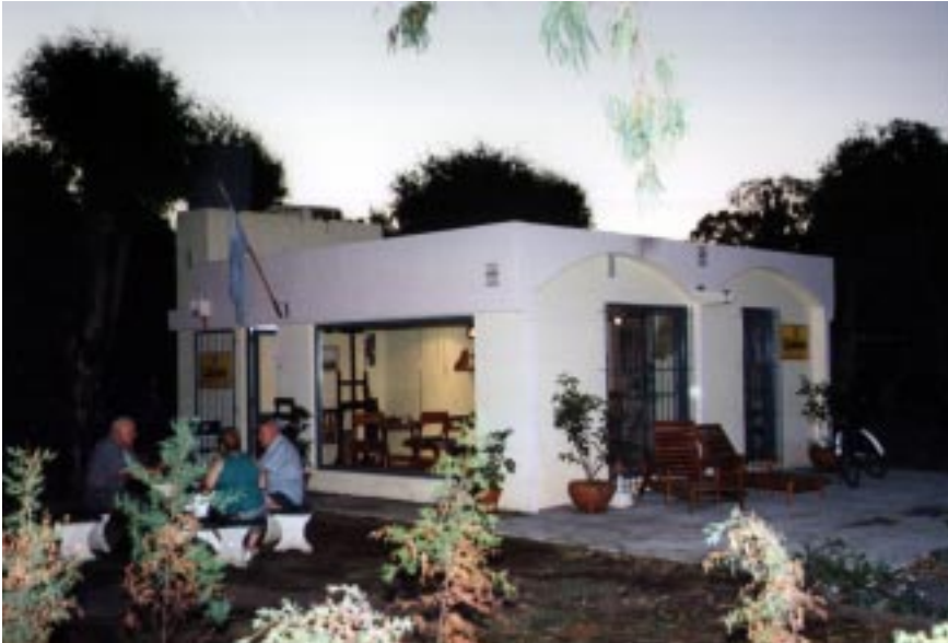
Café Literario, ubicado en el Parque Municipal "Las Acollaradas"

decano de este tipo de encuentros en la provincia; el Desfile de Alta Pintura, una combinación perfecta de arte, colorido, armonía y belleza. A esto se le debe sumar, entre otras, la tarea permanente de la Asociación Musical, encargada de la organización de conciertos de distintos estilos musicales. También, cada fin de semana diferentes acontecimientos reúnen a público de todas las edades, en un intento permanente de revalorizar lo artístico y popular.