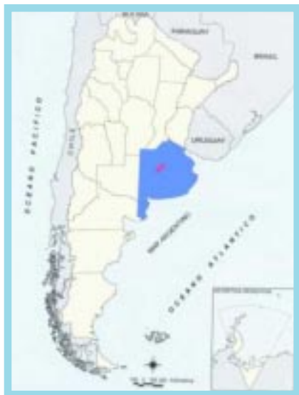
Ubicación territorial del Partido de Bolívar