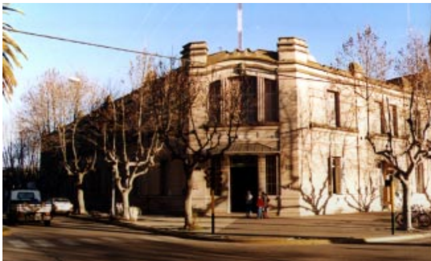
Escuela N° 1

Cuatro escuelas de la Rama Psicología cuentan con casi 700 alumnos. En lo que respecta a educación para adultos, cuatro escuelas, de las cuales dos funcionan en Bolívar, una en