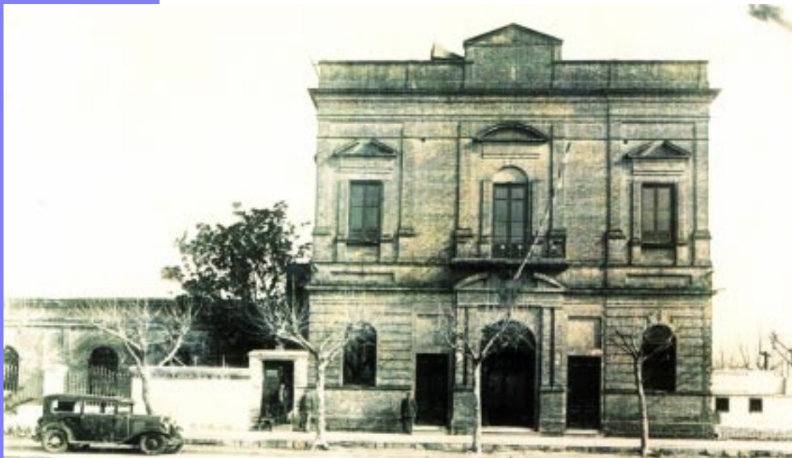
Teatro Coliseo Español

¿Qué sería del mundo sin poesía ni poetas que canten madrigales a la luna, las flores, los trigales brindándole a las cosas armonía?