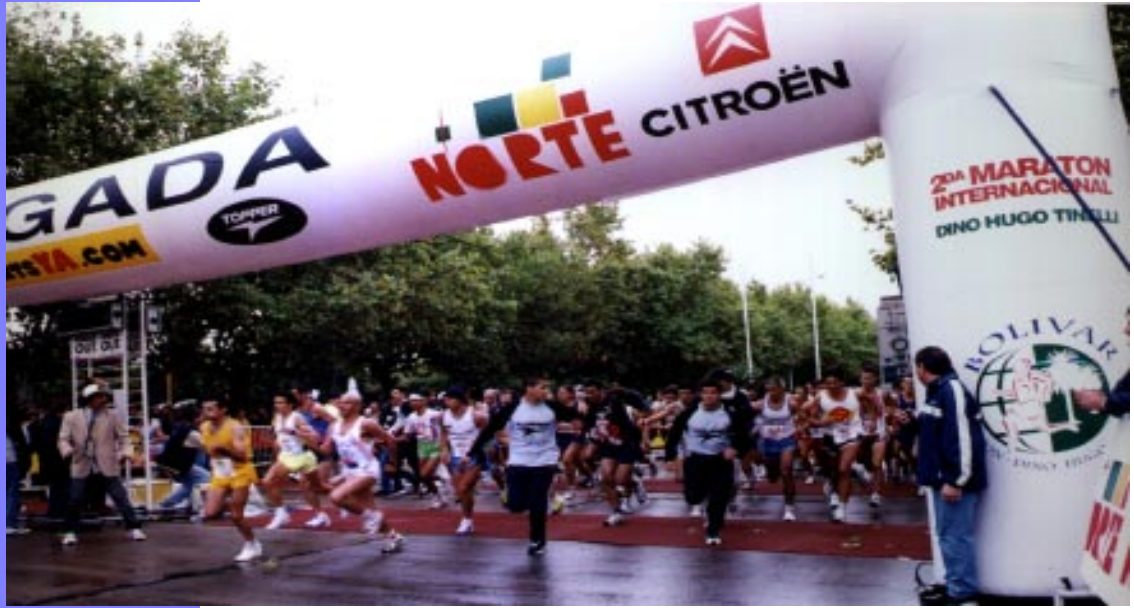
Largada de una de las ediciones de la Maratón, disputada por las calles de Bolívar

“Así en las noches de estío cuando la luna se vela se oyen los cantos que vuelan con sus quiméricos bríos.