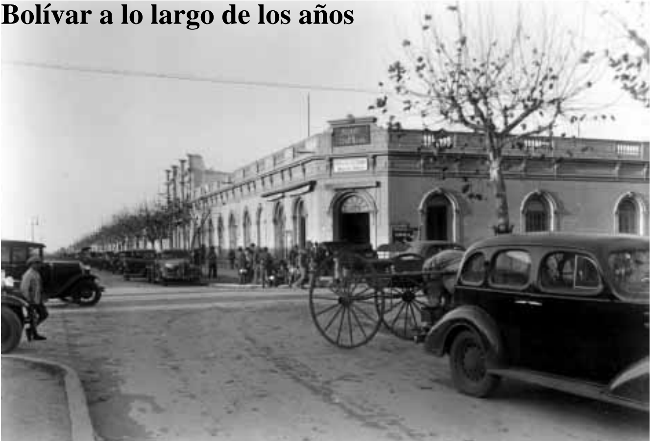
El Hotel La Vizcaína, cuyo edificio es hoy monumento histórico, constituyó durante casi un siglo uno de los sitios con mayor movimiento de la ciudad.

1734 – 1739 – 1754 – 1778 – Se realizan las primeras expediciones a Salinas Grandes, en busca de sal. Las caravanas atraviesan el territorio que hoy ocupa el partido de Bolívar.