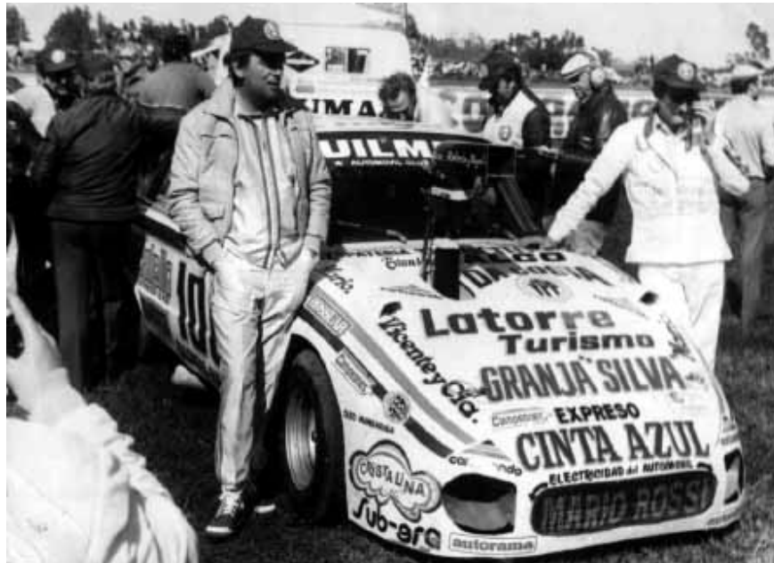
Jorge Martínez Boero, campeón de Turismo Carretera en 1982

Numerosos deportistas locales incursionan con resultados excelentes en distintas disciplinas tanto a nivel regional, provincial como nacional.