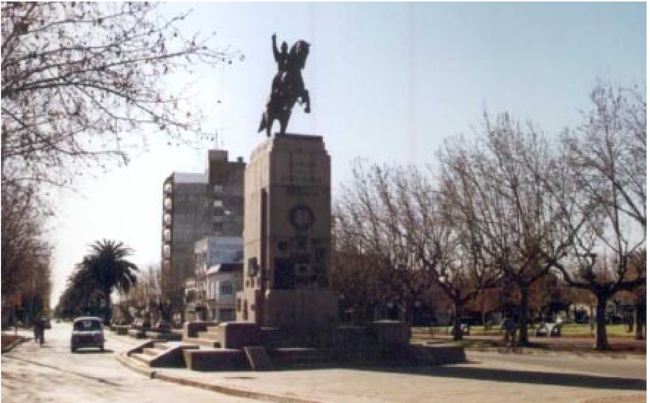
La estatua ecuestre de San Martín tiene una altura de cuatro metros por cuatro metros con noventa y cinco centímetros de largo y está colocada sobre un pedestal de granito construido en el presidio de Sierra Chica.

y pintoresco acceso. Además, la Avenida Pedro Vignau, brinda otra posibilidad de ingreso a la ciudad desde la ruta 65.